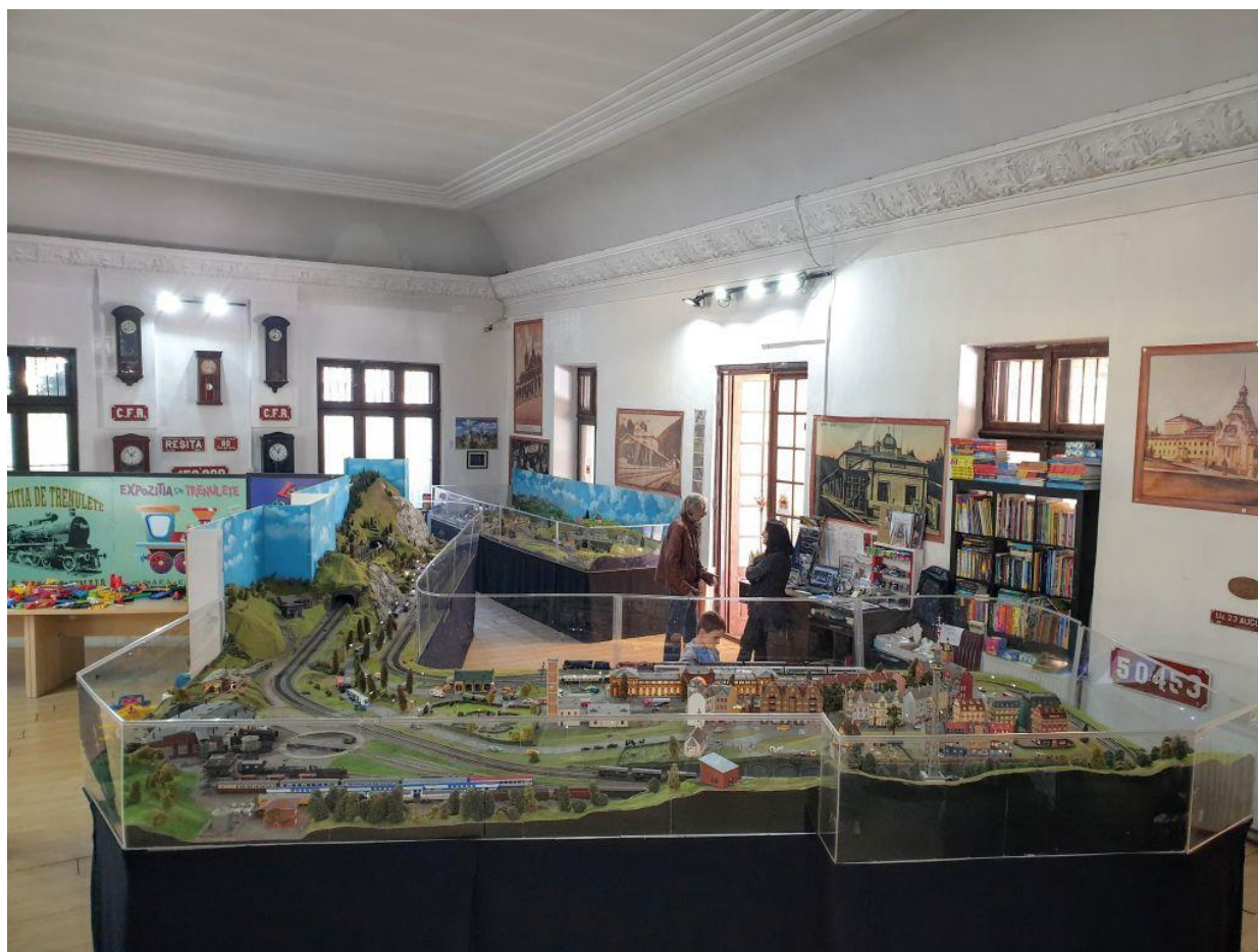
Expoziția trenulețelor din gara Sinaia (fotografia este făcută înainte de pandemie. Expoziția este deschisă, dar nu este accesibil locul de joacă).

Sinaia - Intră în istorie în 1695 datorită mănăstirii construite datorită spătarului Mihai Cantacuzino între 1690 și 1695. Pe atunci era o mică așezare și a rămas așa aproape două secole. Până în 1864 Sinaia a făcut parte, alături de alte sate de pe Valea Prahovei, din comuna Podu Neagului, dar apoi s-a separat și a primit numele Sinaia. A devenit oraș în 1880 și s-a dezvoltat datorită șoselei, a căii ferate și a faptului că familia regală a ales să construiască în localitate castelul Peleş, gata în 1883. Castelul Peleşor a fost gata în 1902, iar cazinoul, în 1912.