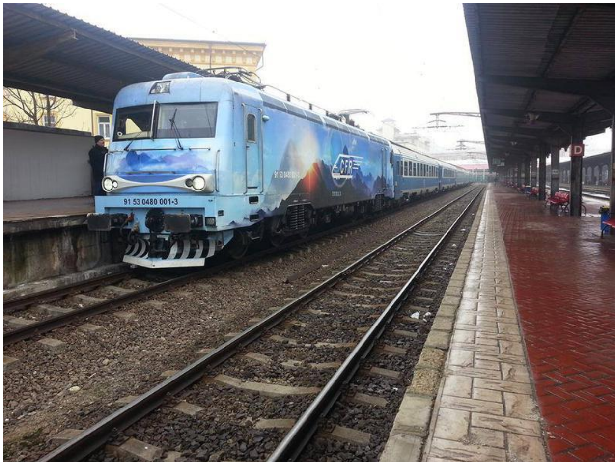
Trenul care în 2015 a făcut sub două ore între cele două orașe

Tracțiunea feroviară era în schimbare în Europa de Vest, iar primele semne s-au văzut și la noi, timid, în 1938 când CFR a adus o singură locomotivă diesel-electrică de mare putere (4.400 CP), construită în Elveția pentru serviciul pe liniile magistrale, și câteva locomotive Diesel-mecanice de 120 CP, pentru serviciul de manevră, construite de Uzinele N. Malaxa din București.