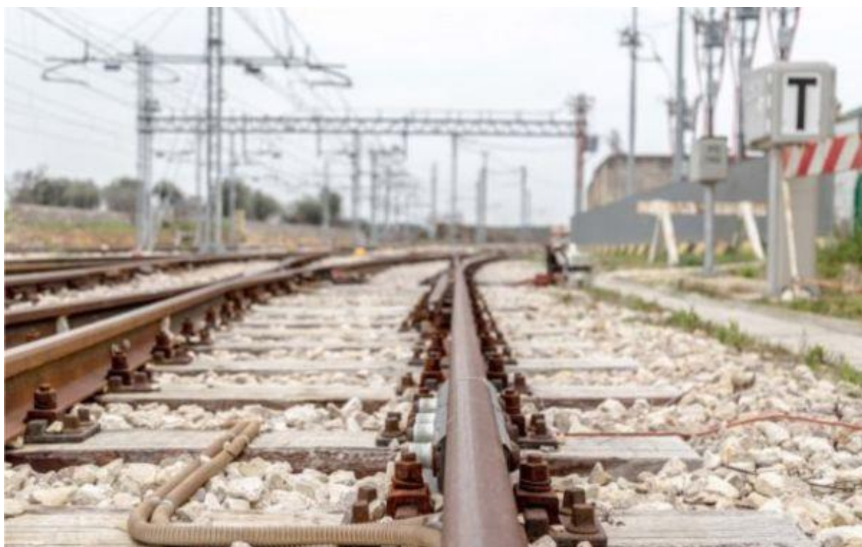
Cale ferată în dreptul unei substații de tracțiune electrică

Premierul Ludovic Orban afirma recent că Guvernul va investi o parte importantă din fondurile europene și pentru modernizarea culoarului IV de transport feroviar paneuropean, pe tronsonul Curtici - București - Constanța. Declarațiile premierului au fost făcute cu prilejul semnării, la sediul Ministerului Transporturilor, contractului de reabilitare a liniei de cale ferată Brașov - Simeria, componentă a Coridorului Rin - Dunăre, pentru circulația cu viteza maximă de 160 km/h, secțiunea Brașov - Sighișoara, subsecțiunea 2 Apața - Cața.