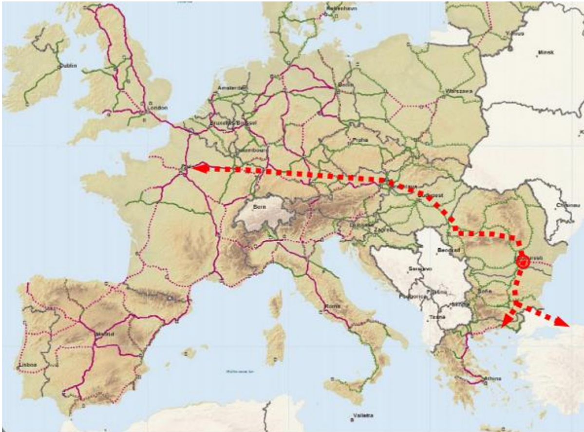
Figura 104 - Conexiune feroviară de mare viteză Europa de Vest - Istanbul/Atena, via București