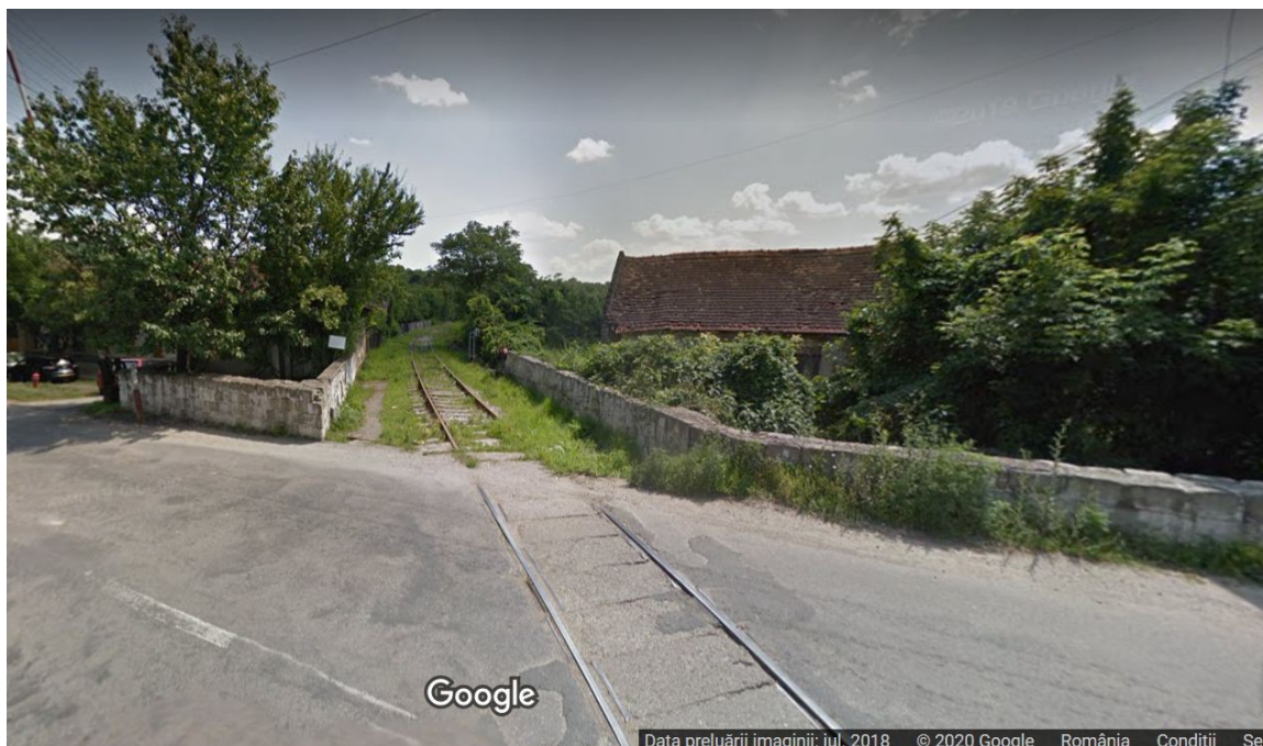
Cale ferată la Oravița

temându-se că locomotivele pot exploda și că hurducăturile simțite de pasageri le pot crea leziuni pe creier.