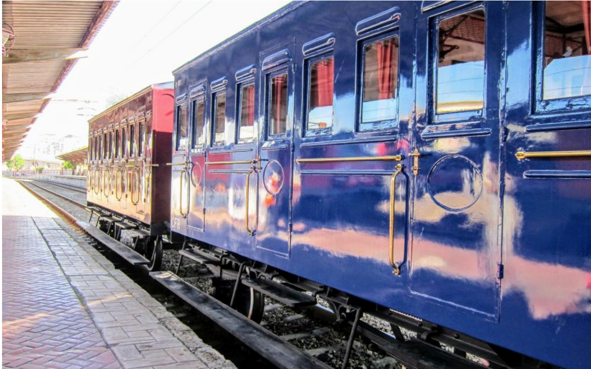
Trenul Călugăreni

Amănunt interesant: existau trei variante pentru prima cale ferată din Principate: de la București către Brăila, Galați sau Giurgiu, cele trei mari porturi. A fost aleasă varianta Giurgiu pentru că era cea mai scurtă, cea mai rapid de construit și cu o singură trecere a unui curs de apă (cea peste Argeș care acum constituie un punct nevralgic al rețelei fiindcă podul de la Grădiștea, peste Argeș, a fost dărâmat de ape în 2005 și nu a fost refăcut nici până acum, iar trenurile ocolesc pe la Videle).