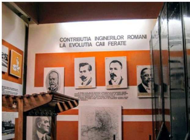
La Muzeul CFR din Gara de Nord

Înainte de a începe povestea trebuie spus că în toate regiunile istorice ale țării primele căi ferate au fost construite de companii străine, lucru normal fiindcă ne aflam atunci sub stăpânire străină și nici nu existau antreprize românești cu experiență în proiecte-mamut.