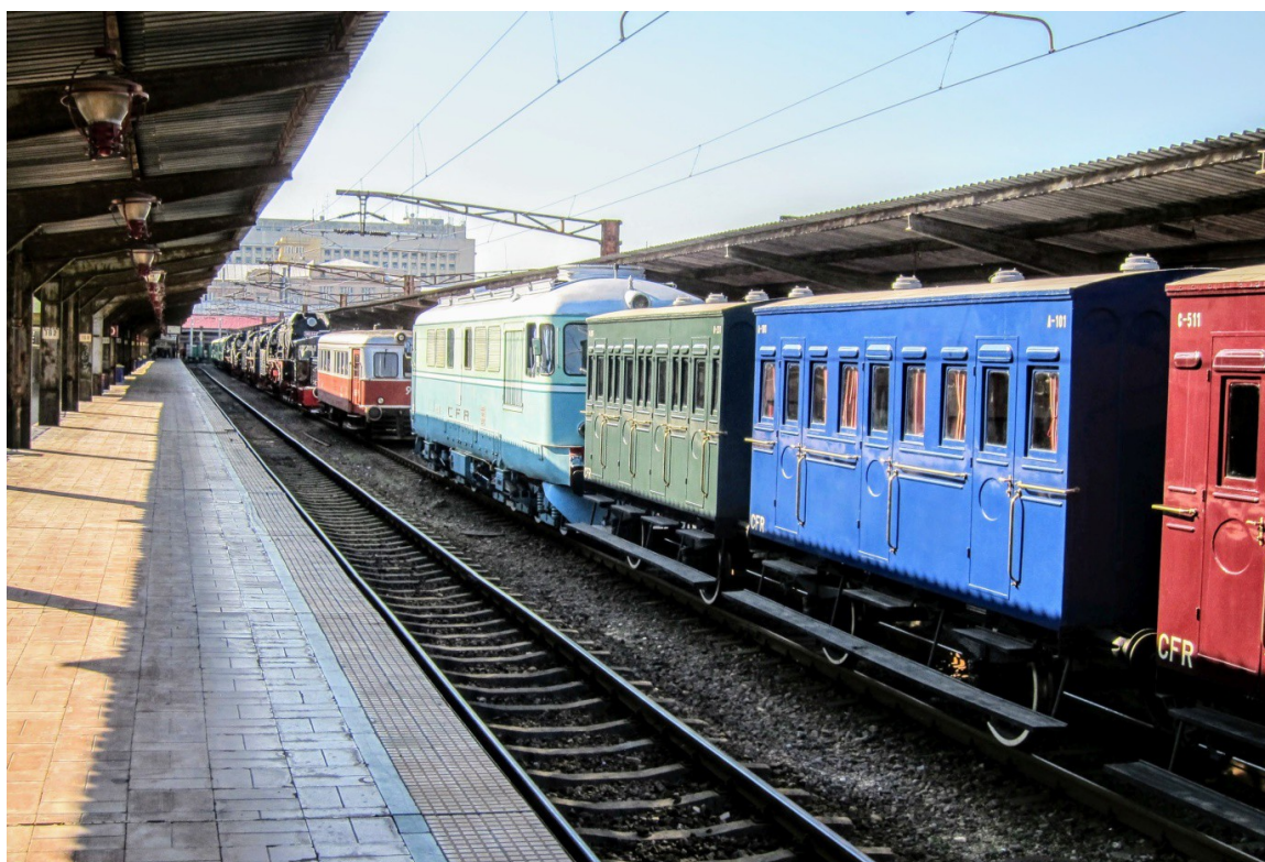
La o expoziție feroviară în Gara de Nord (2014)

Primul tronson important din Ardeal a fost dat în folosință la final de 1868 când întâiul tren intra în Alba Iulia, în ziua de Crăciun. Orașul era acum legat de Arad (211 km distanță) și implicit de Viena și de Pesta (capitala maghiară ce avea să se unească cu Buda în 1876, devenind Budapesta). La 1868, cei 145 km dintre Arad și Deva erau parcurși în patru ore. În prezent nu suntem departe, drumul fiind de 3 ore și 20 de minute, însă pentru că se lucrează pentru modernizare pe porțiuni lungi.