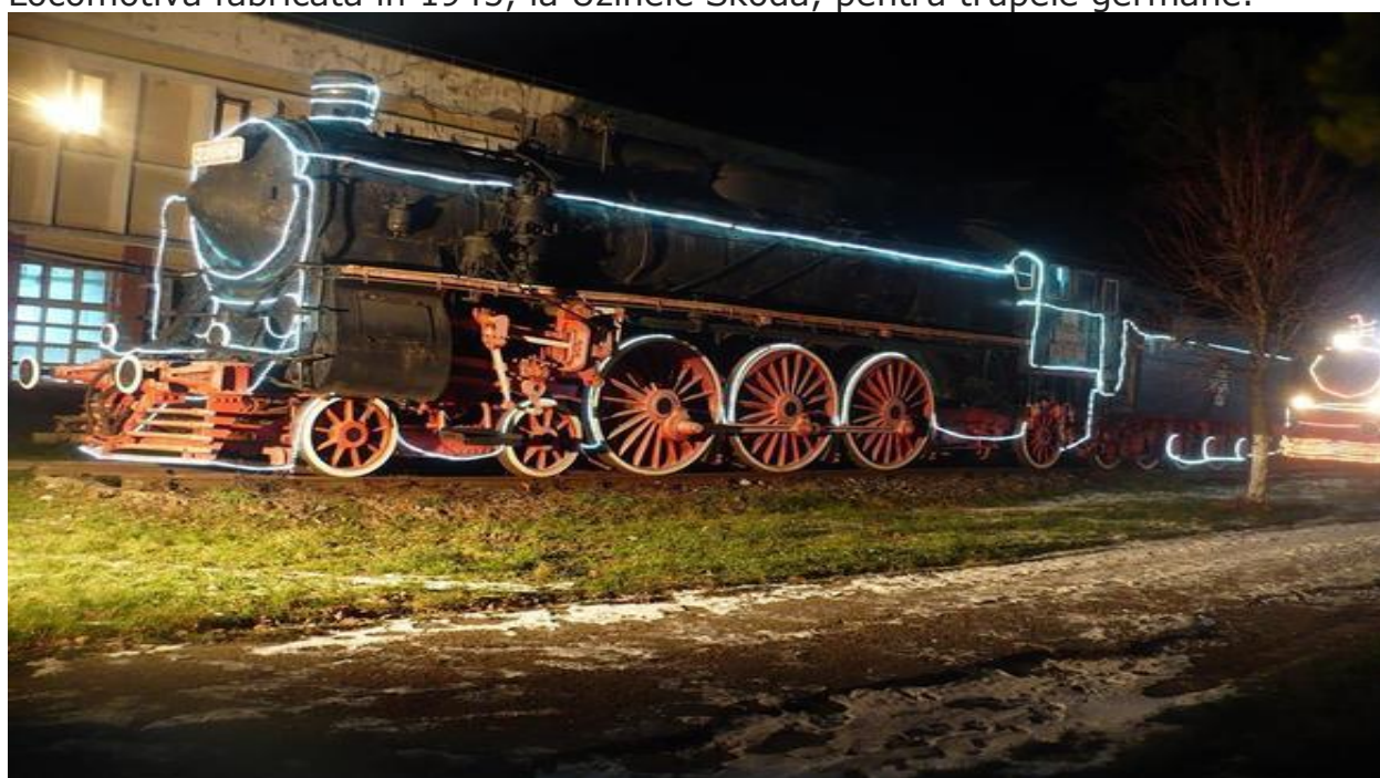
Locomotivă folosită în filmul „Trenul vieții”.