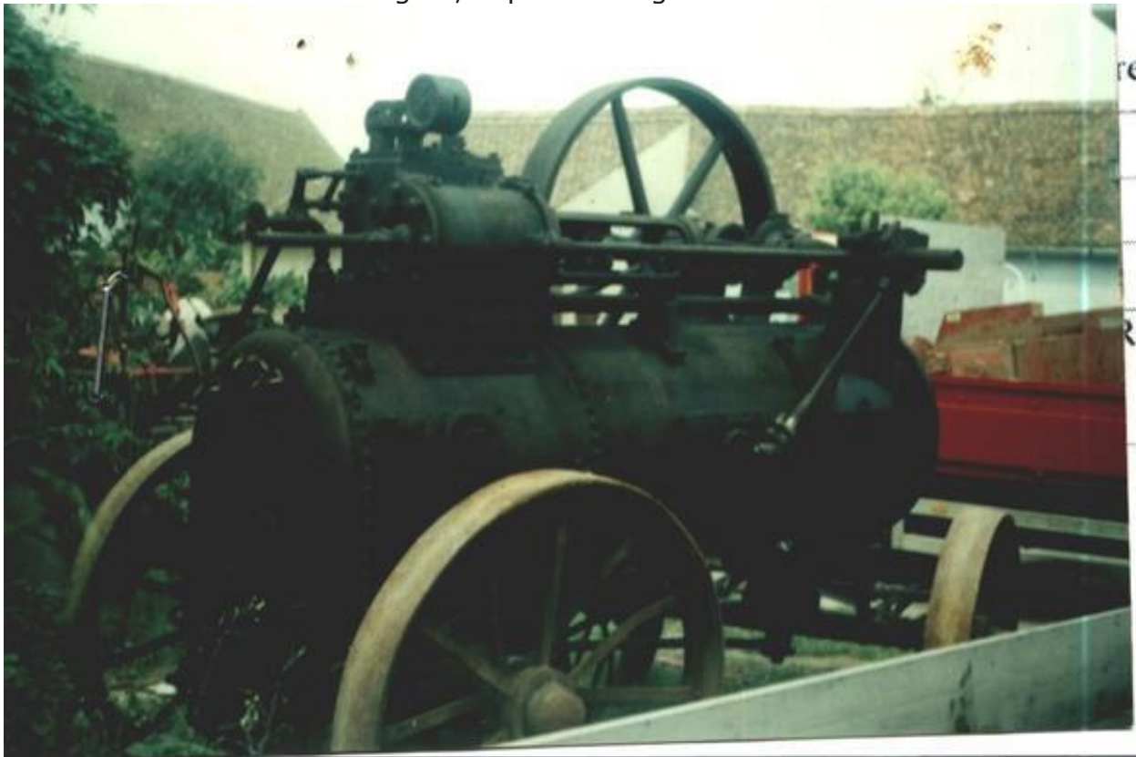
Locomobil, construit în 1910-1920 în Anglia, exportat ilegal.