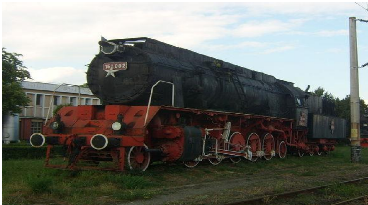
Locomotivă fabricată în 1945, la Uzinele Skoda, pentru trupele germane.

locomotive fabricate la Reșița, în aceeași perioadă, dar și unele dintre primele locomotive electrice ale Căilor Ferate Române.